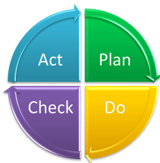
Figura 3 - Ciclo PDCA.

As metas e objetivos propostos no Plano serão controlados e melhorados de maneira contínua seguindo-se as etapas do Ciclo do PDCA (Figura 3), descritas a seguir.