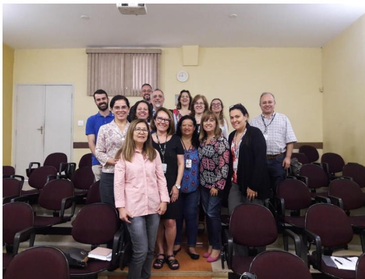
Professores e Técnicos Administrativos em Educação