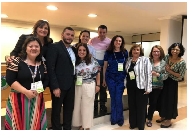
Palestrantes e coordenadores do Simpósio

crescimento, desenvolvimento e repercussões futuras. O evento contou com a participação de 68 ouvintes, entre eles profissionais de enfermagem, fisioterapia, fonoaudiologia, medicina, nutrição, odontologia, psicologia e terapia ocupacional. Alguns dos participantes eram provenientes de outros estados brasileiros, como Tocantins, Rio Grande do Norte e Pernambuco, atraídos pela abrangência dos temas abordados sobre seguimento multiprofissional da prematuridade. Com o intuito de melhorar a qualidade de atendimento dos pacientes prematuros, novos eventos serão promovidos pela Disciplina de Pediatria Neonatal do Departamento de Pediatria.