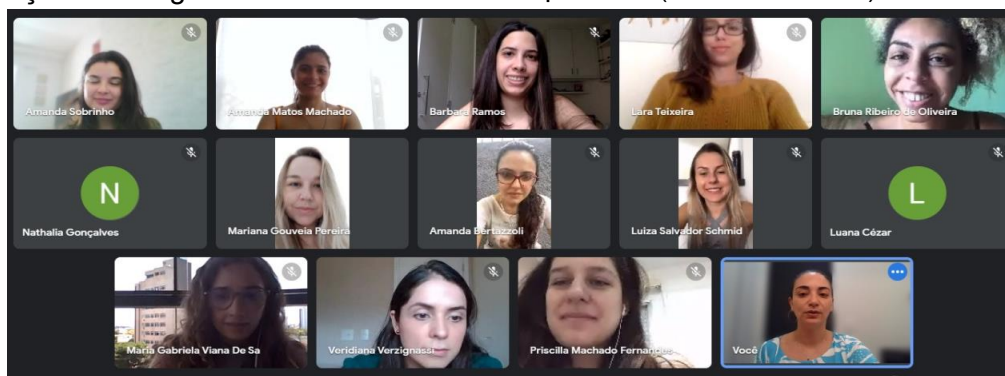
Disciplina de Alergia, Imunologia Clínica e Reumatologia Pediátrica - Turma 2021.

Erros Inatos da Imunidade em pacientes com doença inflamatória intestinal de início muito precoce” contou com a maior casuística publicada nacionalmente até o momento. Um prêmio como esse nos lembra da importância das parcerias e a união que sempre foi um destaque no nosso Departamento. O reconhecimento acadêmico transforma perspectivas e impulsiona o saber. Mostra que é essencial despertar a curiosidade do residente e do aluno. Como diz Paulo Freire: “Ensinar não é transferir conhecimento, mas criar possibilidades para sua própria construção”. Parabéns residentes, pós-graduandos e professores! “Diante de tempos tão difíceis, um reconhecimento como esse ecoa como um carinho no momento preciso” (Mario Quintana).